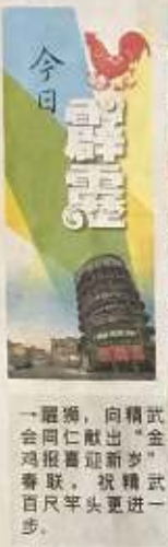
一躍獅，向精武同仁獻出“金雞報春迎新步”春聯，祝精武百尺竿頭更進一步。