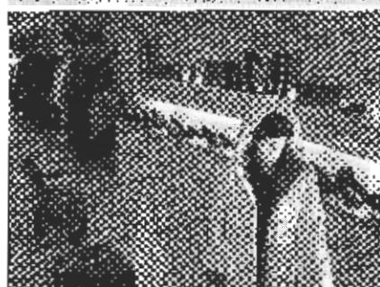
Bei TOSCA scarpe e moda gibt es elegante und lässige Kleider zu bestaunen.

ein. Nicht nur der bezaubernde Blick durch die liebevoll dekorierten Schaufenster lädt zu einer Stippvisite im bereits vor einem Jahr eröffneten Laden TOSCA, an der Marktgasse 6 in Thun, ein.