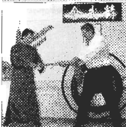
Die Chin-Woo-Familie feierte Geburtstag.